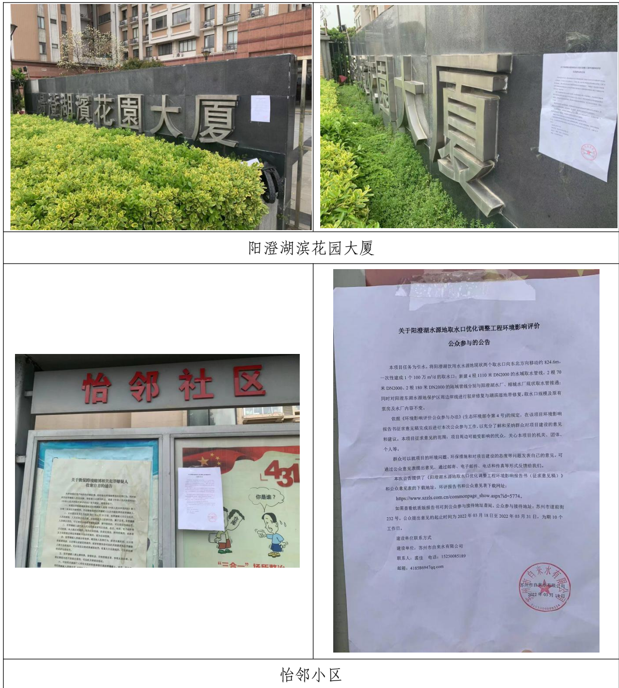
图 3.2-3 现场张贴公告照片

我公司在周边社区进行了张贴公开，易于周边公众了解获取，符合载体选取要求。公示时间为 2022 年 03 月 18 日至 2022 年 03 月 31 日。现场照片见图 3.2-3。