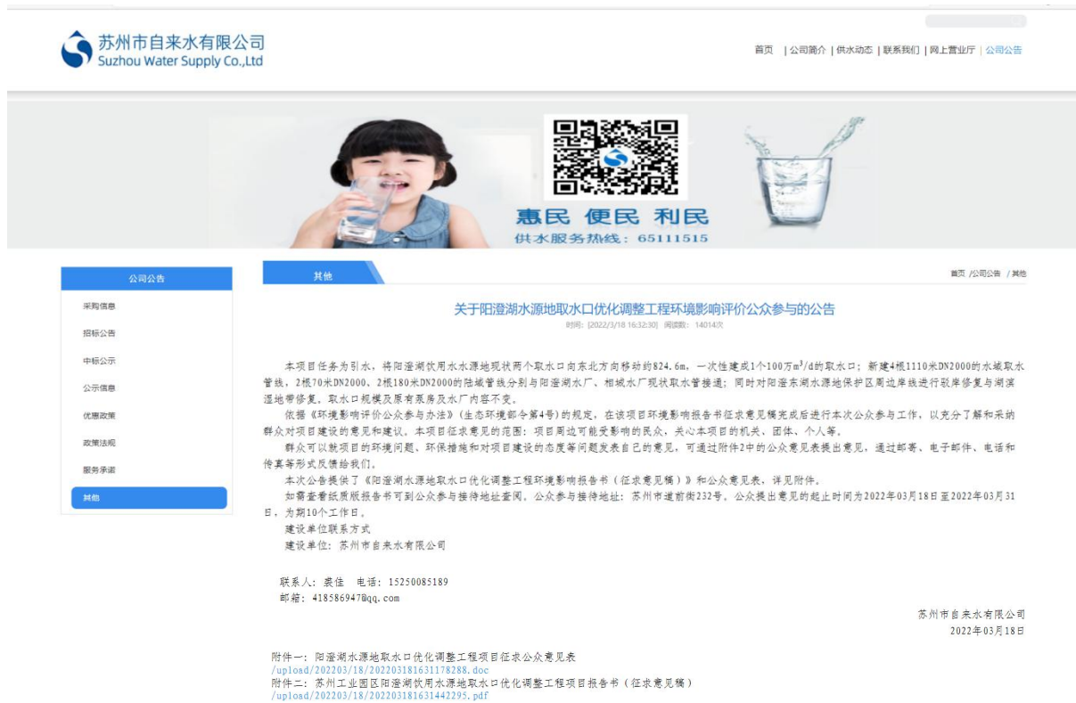
图 3.2-1 (1) 征求意见稿公示截图

上进行了公示,并附上环境影响报告书征求意见稿及公众意见表作为附件。公示截图见图 3.2-1。网络公示期间未收到公众反馈意见。