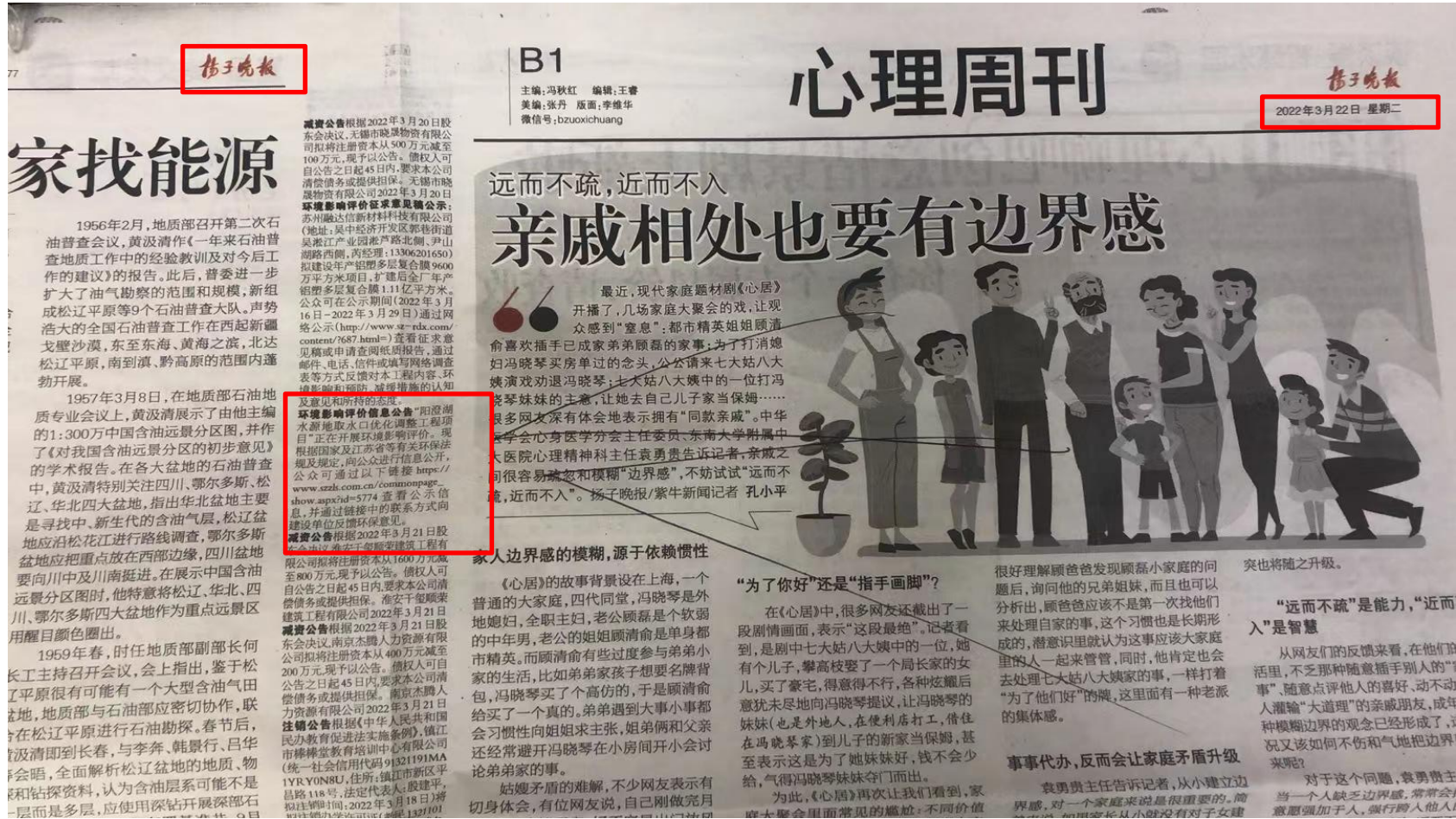
图 3.2-2 (1) 报纸公示截图